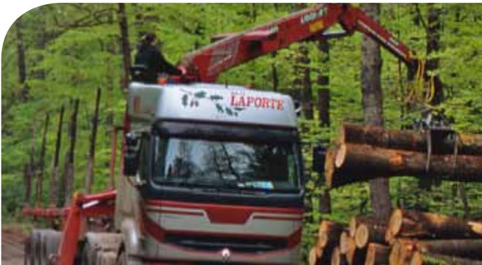
STÄRKUNG DER WETTBEWERBSFÄHIGKEIT DES SEKTORS WALD-FORST-HOLZ

■ Die Bayerische Forstverwaltung hat 14 Arbeitsfelder definiert, in denen die übergeordneten Kernbotschaften konkret in die Praxis umgesetzt werden.