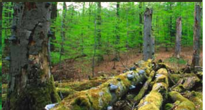
NATURSCHUTZ IM WALD