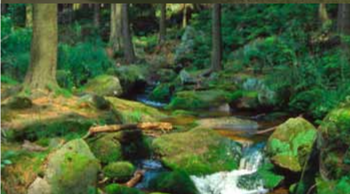
SCHUTZ VON WASSER UND BODEN